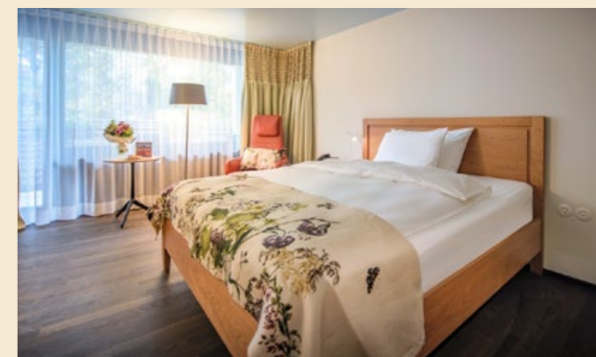
ZIMMER Klassische Eleganz – alle achtzig Zimmer wurden Anfang 2018 renoviert und neu eingerichtet.